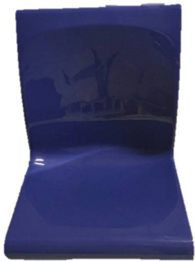
圖 1 單人座椅