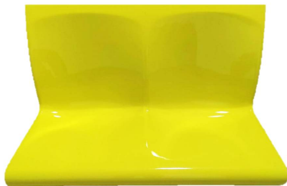
圖 2 2人座椅