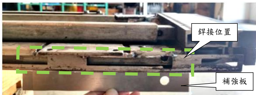
圖 3 補強板鉚接位置

(2)廠商製作補強板(參考尺寸:215x26x2 mm)，再將補強板安裝在車間通道側翼板開口處內側，安裝位置詳圖 3 方框處。