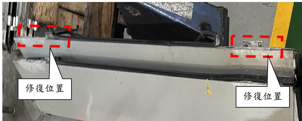
圖 1 側翼板上、下 2 處修復位置