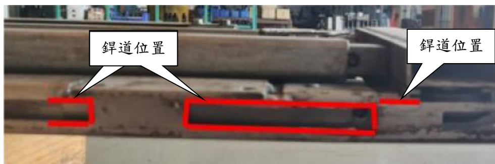
圖 4 補強板銲道位置

(4)將銲道進行修整，確保銲道表面，並檢查銲道沒有裂縫、氣孔、熔合不良等瑕疵，且銲道高度不會影響側翼板安裝，方為完成。