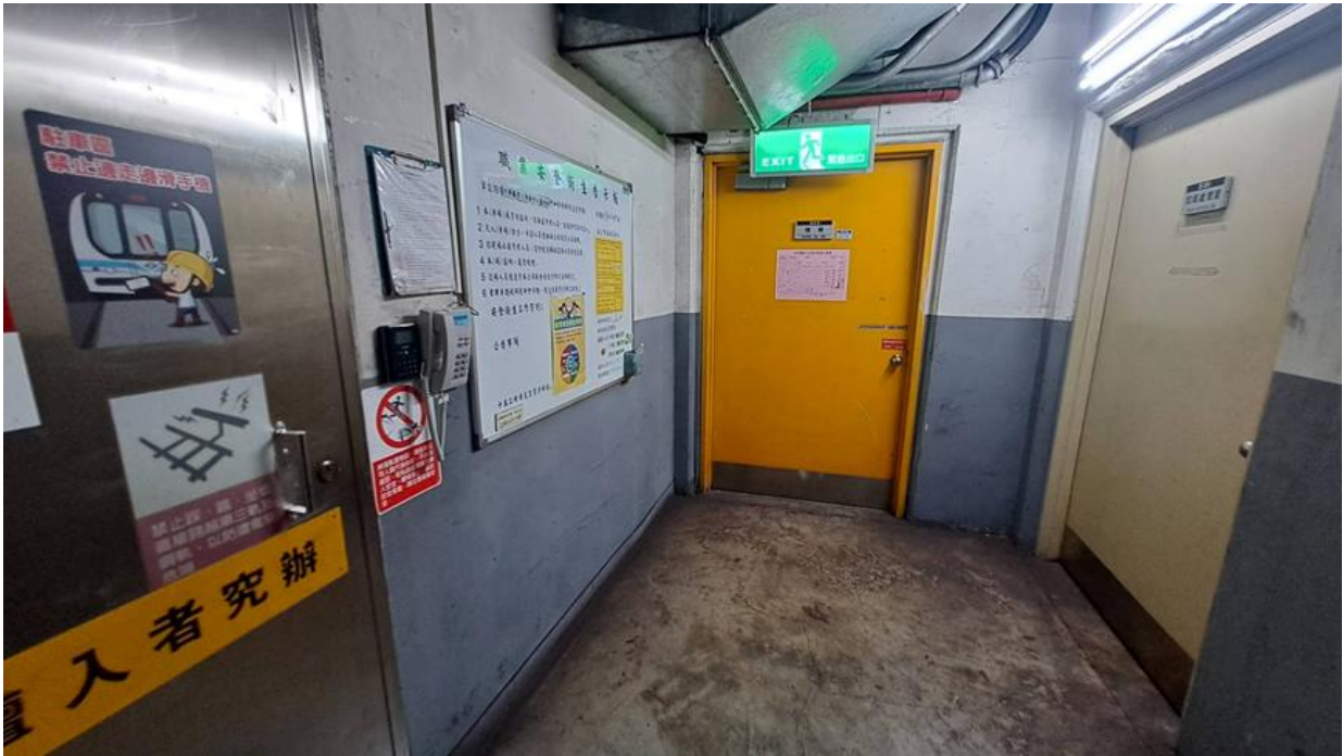
(4)中和機廠電梯下乘場出口處牆面-4