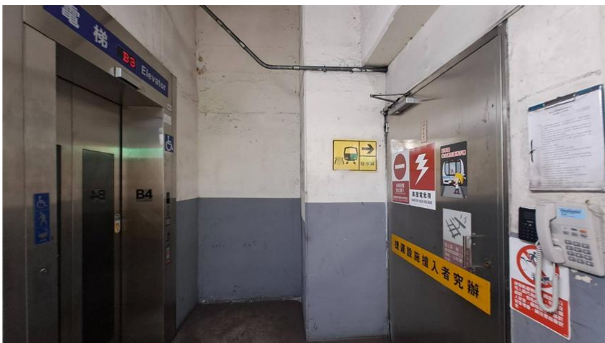
(6)中和機廠電梯下乘場出口處牆面-6