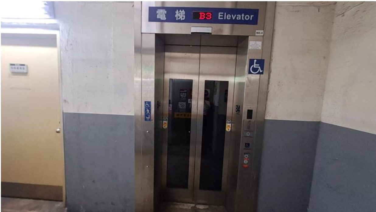
(2)中和機廠電梯下乘場出口處牆面-2