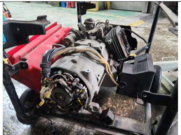
發電機發電線圈老舊