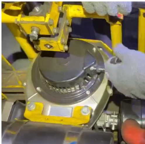
鋼軌研磨機引擎縮缸無法發動