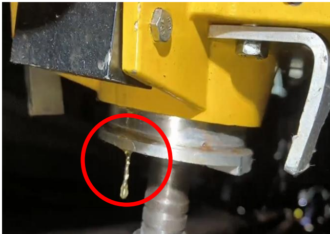
螺栓旋緊機齒輪箱漏油