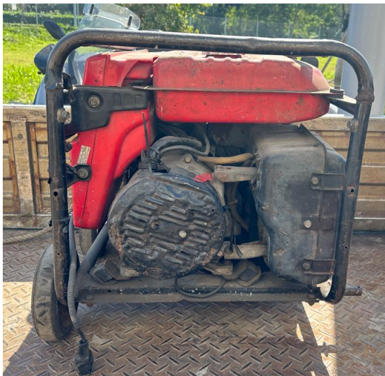
發電機底座破損歪斜