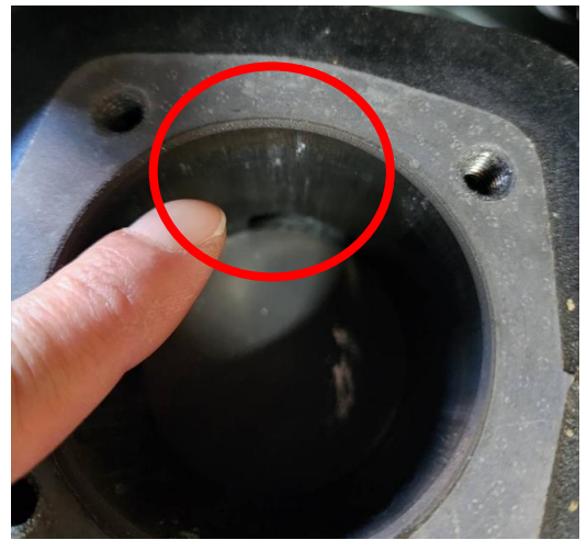
鋼軌研磨機汽缸壁磨損