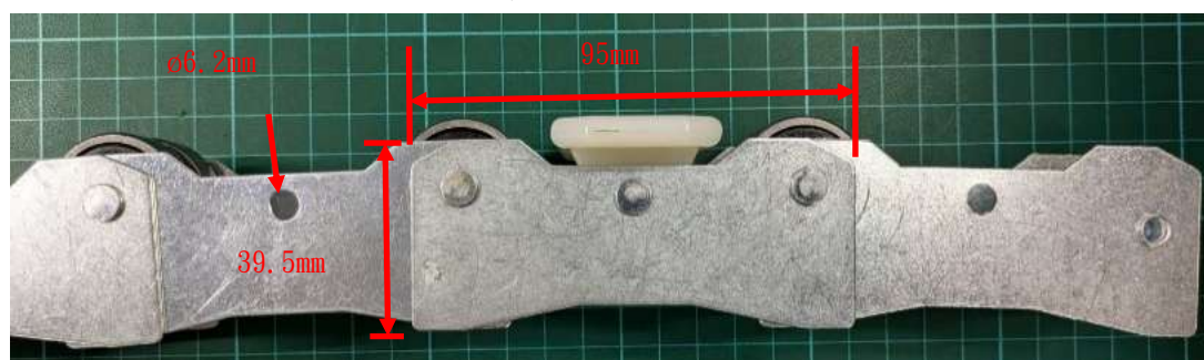
圖 3、扶手帶端部滾輪頭端上視圖