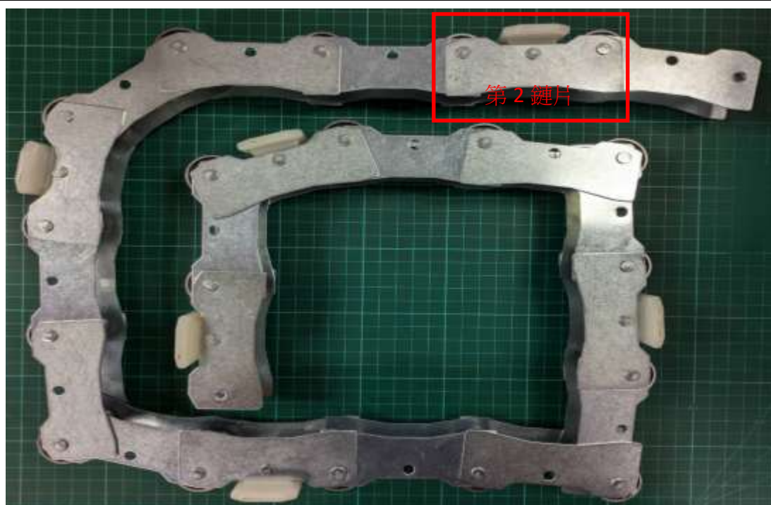
圖 2、扶手帶端部滾輪整體前視圖